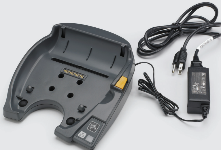
QLn420-Lade- und Ethernet-Docking-Station