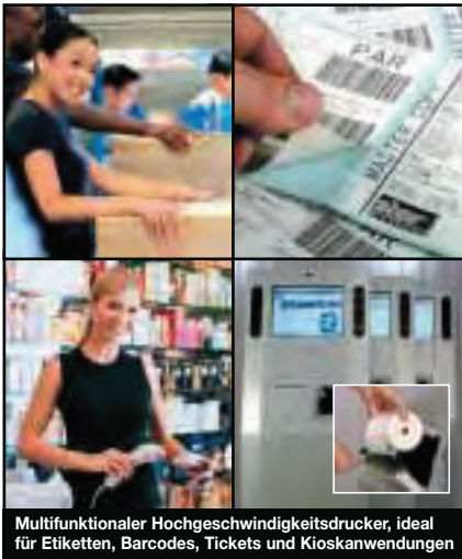
Multifunktionaler Hochgeschwindigkeitsdrucker, ideal für Etiketten, Barcodes, Tickets und Kioskanwendungen