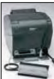
TSP700II Ausgangs- verbindung