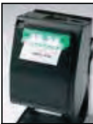
Neue blinkende Papierausgangsführung