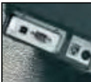
Es sind Modelle mit seriellem, parallelem und USB-Anschluss sowie eine schnittstellenfreie Version zur Verwendung mit Ethernet oder WiFi erhältlich