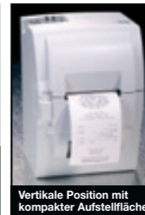
Vertikale Position mit kompakter Aufstellfläche