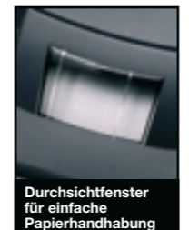
Durchsichtfenster für einfache Papierhandhabung