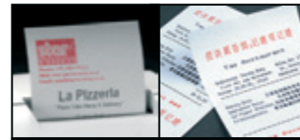
Zweifarbige, hochwertige Grafikdrucke