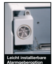
Leicht installierbare Alarmgeberoption