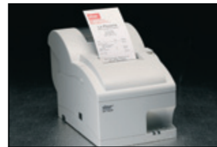
NEUE Star SP700 Rücklaufversion