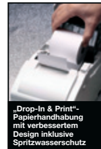
„Drop-In & Print“-Papierhandhabung mit verbessertem Design inklusive Spritzwasserschutz

Alle erhältlich in Star-Weiß oder Dunkelgrau als Modell mit serieller, paralleler, USB- (WHQL-zertifiziert) oder ohne Schnittstelle.