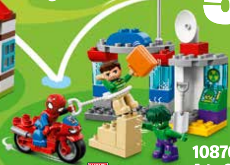
10876 Age 2-5