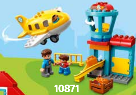
10871 Age 2-5