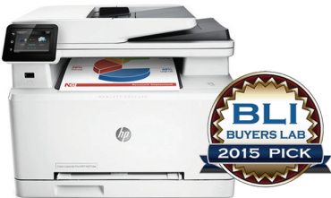
Hewlett-Packard Company Color LaserJet Pro MFP M277dw Outstanding SOHO Colour MFP