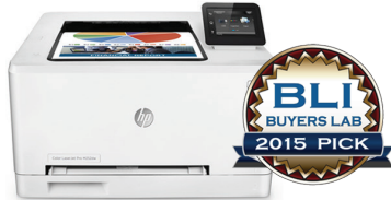
Hewlett-Packard Company Color LaserJet Pro M252dw Outstanding SOHO Colour Printer