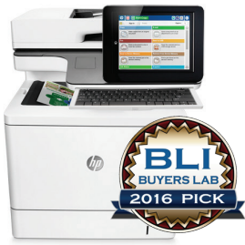
HP Inc. LaserJet Enterprise MFP M577 Series Outstanding Colour MFP for Large Workgroups

Professionelle Druckqualität ganz ohne Wartezeit