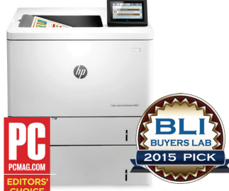
PC PCMAG.COM EDITORS' CHOICE Hewlett-Packard Company Color LaserJet Enterprise M553 Series Outstanding Colour Printer for Mid-Size to Large Workgroups