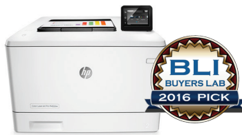
HP Inc. Color LaserJet Pro M452 Series Outstanding Colour Printer for Small Workgroups