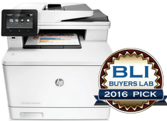
HP Inc. Color LaserJet Pro MFP M477 Series Outstanding Colour MFP for Small Workgroups