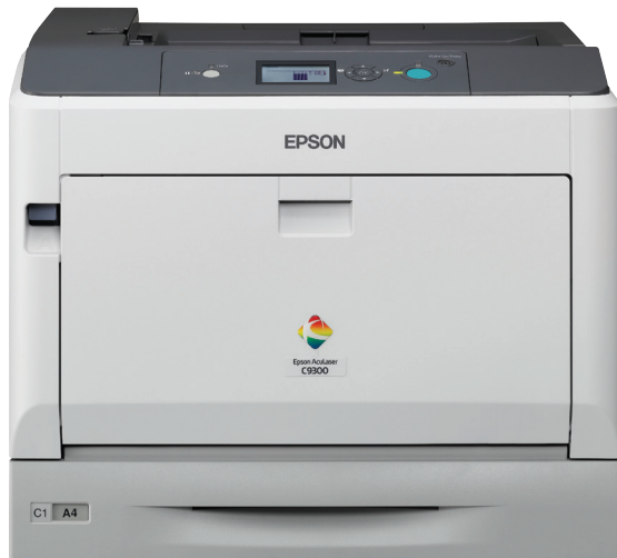
Abgebildetes Modell: Epson AcuLaserC9300N

Die DIN A3-Farblaserdrucker der Epson AcuLaser C9300N-Serie bieten mittleren bis großen Arbeitsgruppen in Unternehmen professionelle Ausdrücke mit einer der besten Druckqualität in dieser Produktklasse.