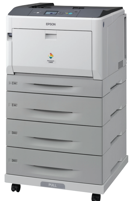
Abgebildetes Modell: Epson AcuLaserC9300D3TNC mit Duplexeinheit, 3 zusätzlichen Papierkassetten und Ständer