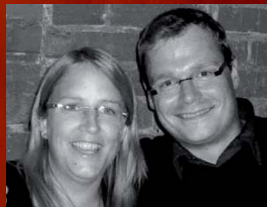
Illustration: Rolf Vogt ARVI