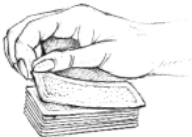
Aufdecken einer Karte

Um sich selbst nicht in einen Vorteil zu bringen, wird die Karte (mit der offenen Seite nach vorne) von sich weg umgedreht. Je schneller die Bewegung, desto schneller sieht man auch selbst die offene Karte.